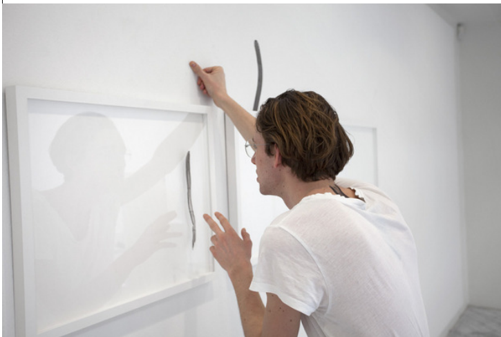
Honza Hoec: A leaf growing into the ground, falling back on a branch (Installation view).

Udstillingen viser hvordan en kunstners materialer kan igangsætte mange forskellige processer, og hvordan kunsten kan operere på flere forskellige niveauer på samme tid. En udforskning af materialers formåen og begrænsninger går hånd i hånd med store eksistentielle overvejelser, serveret på en yderst visuelt tilfredsstillende vis for beskueren.