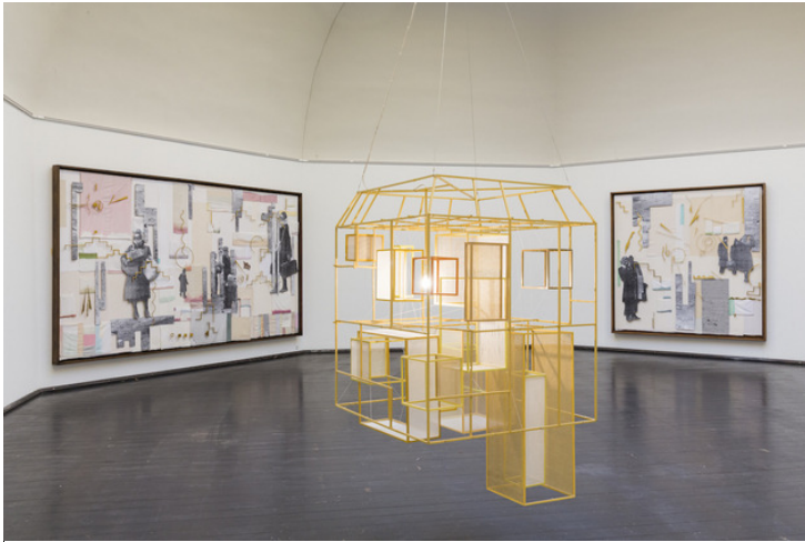
Kirstine Roepstorff: MOON SKIN LUCID WALK (installation view), Den Frie, 2015.