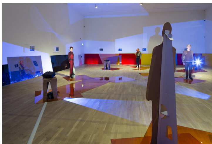
Lutz Bacher: Into the Dimensional Corridor (installation view), x-rummet, Statens Museum for Kunst, 2014.