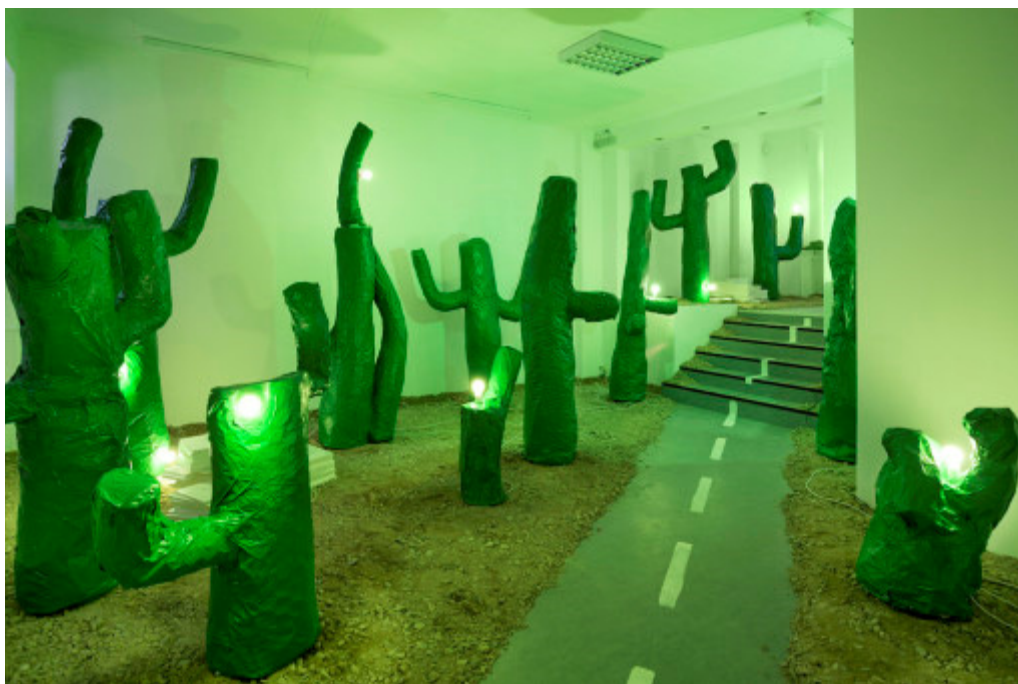
SQ, Screenlord , 2015. Installation view, X and Beyond , 2015.

Tranen, Gentofte Hovedbibliotek, Hellerup + X and Beyond , København.