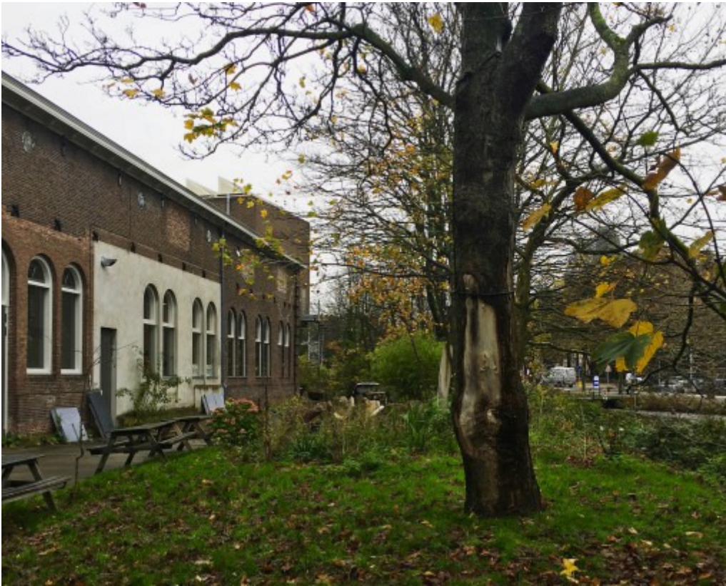
Rijksakademie von den beeldende kunst, 17. november, 2015.

Rijksakademie van beeldende kunst, Amsterdam.