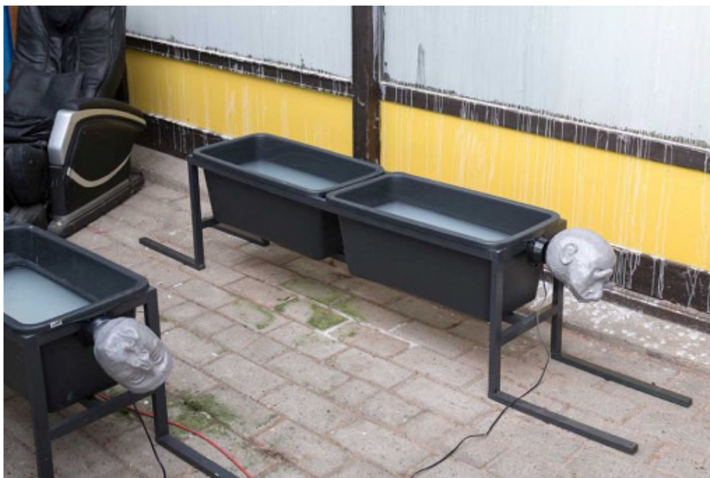
Rolf Nowotny, Støbt Ustøbt Støbt Igen , 2015.

Rolf Nowotny, Støbt Ustøbt Støbt igen , Rolf Nowotnys barndomshjem i Jægerspris.