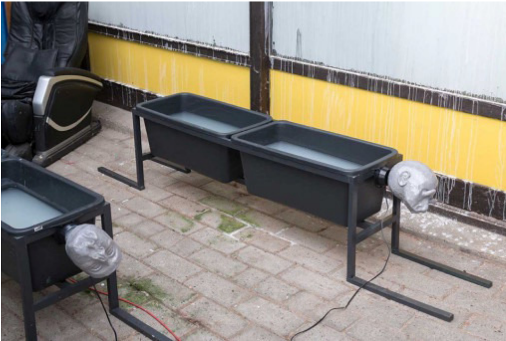
Rolf Nowotny, Støbt Ustøbt Støbt Igen , 2015.

Rolf Nowotny, Støbt Ustøbt Støbt igen , Rolf Nowotnys barndomshjem i Jægerspris.