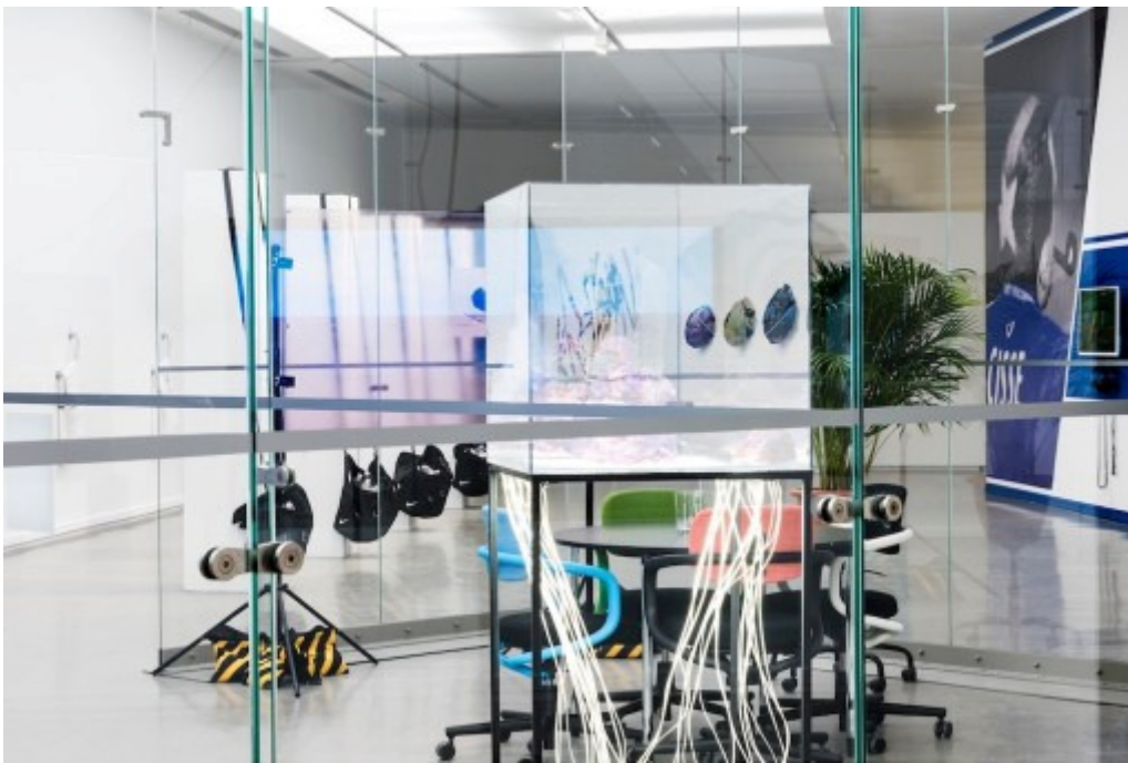
Co-Workers. Network as Artist , installation view, Musée d'Art Moderne de la Ville de Paris.

Co-Workers – Network as Artist , Musée d'Art de la Ville de Paris, kurateret af Angeline Scherf, Toke Lykkeberg og Jessica Castex + Surround Audience , New Museum Triennial, New York, kurateret af Lauren Cornell og Ryan Trecartin.