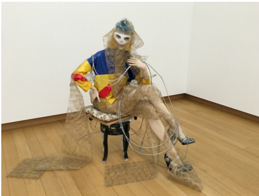
Isa Genzken, Schauspieler , 2013. Stedelijk Museum, 2015.

Isa Genzken, Mach Dich Hübsch , Stedelijk Museum, Amsterdam.