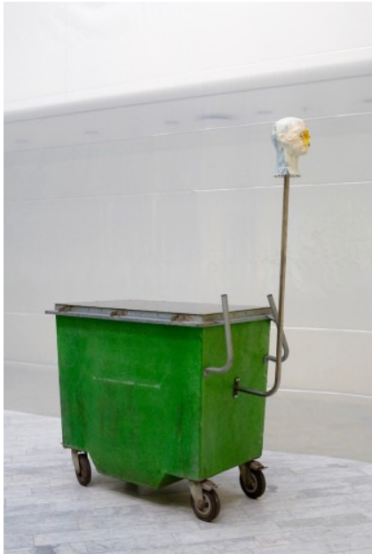
Rolf Nowotny, Sur Pollen , 2015, detalje. Tranen , 2015.

Lugten af det rådne er derfor kun til stede som en olfaktorisk hukommelsessansning, som blot synet af en affaldscontainer prompte fremkalder. Hvor en container er symbolet på fordærv, så er zombien det samme, hvorfor en «container-zombie», som Nowotny her har skabt, næsten bliver en tautologi. For zombien er nok død og i forrådnelse, men den er alligevel i live. Stump, dum, og kold er den, mens dens overlevelsesinstinkt er knyttet til sulten efter levende kød. I denne sammenhæng bliver zombie-figuren virkelig interessant; for er den ikke netop – levende død som den er, uden bevidsthed, men dog med drift – en metafor for den spekulative realisme i yderste potens?