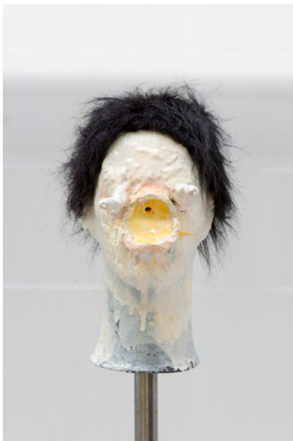
Rolf Nowotny, Sur Pollen , 2015, detalje. Tranen, 2015.

Fem grønne containere står spredt rundt i Tranens hjørnerum. Rummet er til udstillingen blevet afgrænset af plastic, der skaber en lidt ubehagelig følelse af crime scene – og man tænker uvægerligt på de bunker af lig, der i utallige krimier er blevet gennet af vejen i netop sådan en model. Ellers bruges containere som bekendt til ophobning af skrald og fordærvet føde.